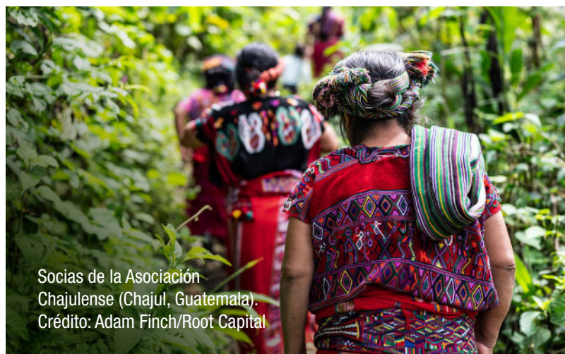
Socias de la Asociación Chajulense (Chajul, Guatemala).

En junio, publicamos conjuntamente un informe sobre las buenas prácticas para cerrar la brecha de género en las inversiones agrícolas. El informe, que incluía estudios de casos de los tres inversores de impacto, proporcionaba una sólida base empírica para que otros donantes e inversores adoptaran las prácticas de GLI. Al mes siguiente, compartimos las principales conclusiones del informe y debatimos los retos comunes y las lecciones aprendidas en un seminario web dirigido por nuestros socios.