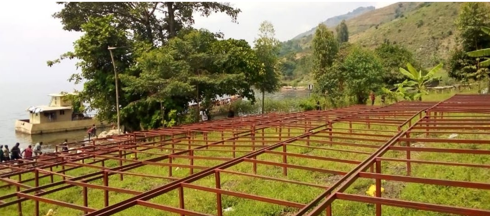
Los lechos para secado de café reconstruidos de Rebuild Women's Hope.